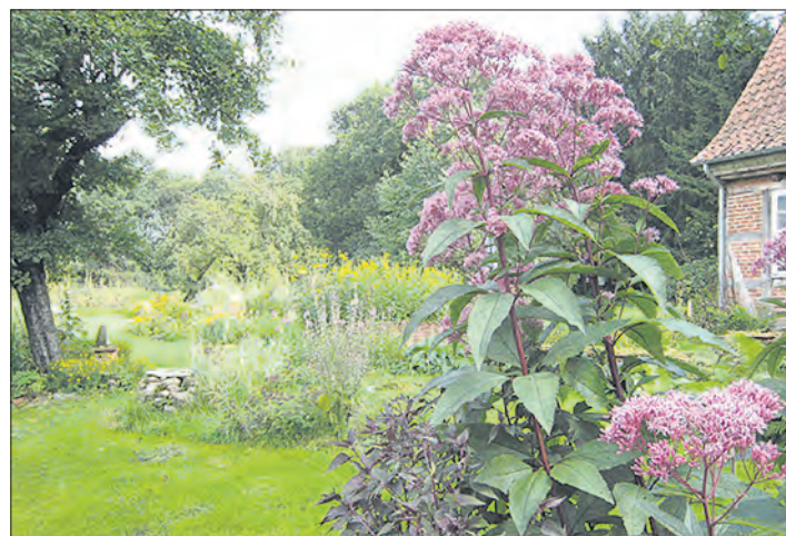
Am Sonnabend und Sonntag von 11 bis 18 Uhr für Besucher geöffnet: Das 7500 Quadratmeter große Grundstück von Gela Kraft.

Auch Edda und Winfried Langehilmers in Markendorf, Meierweg 22, öffnen am Sonntag, dem 30., ihren parkähnlichen Garten. Viele außergewöhnliche Gehölze, die Vielfalt von Stauden und Blumen sowie die individuelle Gartengestaltung auf 4.000 Quadratmetern schaffen eine besondere Atmosphäre.