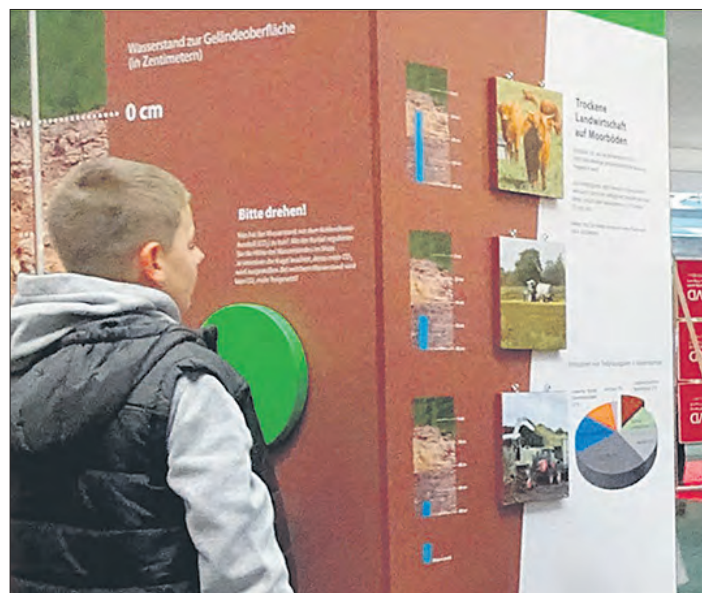
„Moor macht Klima“: Am Ausstellungsmodul im Schneverdinger Rathaus gibt es interessante Informationen zum Thema Moorschutz.