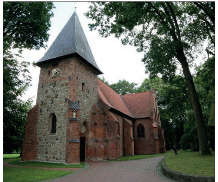
Die Munsteraner St. Urbanikirche.

der schönsten alten Heidekirchen. Ein weiteres Gotteshaus, das ebenfalls einen Besuch wert ist, ist die in einem 150 Jahre alten Schafstall errichtete und 1989 geweihte Kirche St. Martin. Bei vielen Festen und der Reihe „Music in the City“ mit Live-Konzerten auf dem Marktplatz in den Sommermonaten lädt Munster zum geselligen Beisammensein ein. Ebenso spielt Sport in der Örtzstadt eine wichtige Rolle, wie sich unter anderem bei Veranstaltungen wie dem Volksradfahren am 3. Juli, beim Munsteraner Jedermann-Triathlon am 16. Juli und beim Tag der DLRG am 20. August am Flüggenhofsee zeigt. Natürlich stehen für Sportinteressierte in Munster viele Möglichkeiten und moderne Trainingseinrichtungen offen, wie zum Beispiel das Allwetterbad am Sportpark Osterberg. Badevergnügen und Erholung bietet auch der nahegelegene Flüggenhofsee, auf dem auch gesurft werden kann.