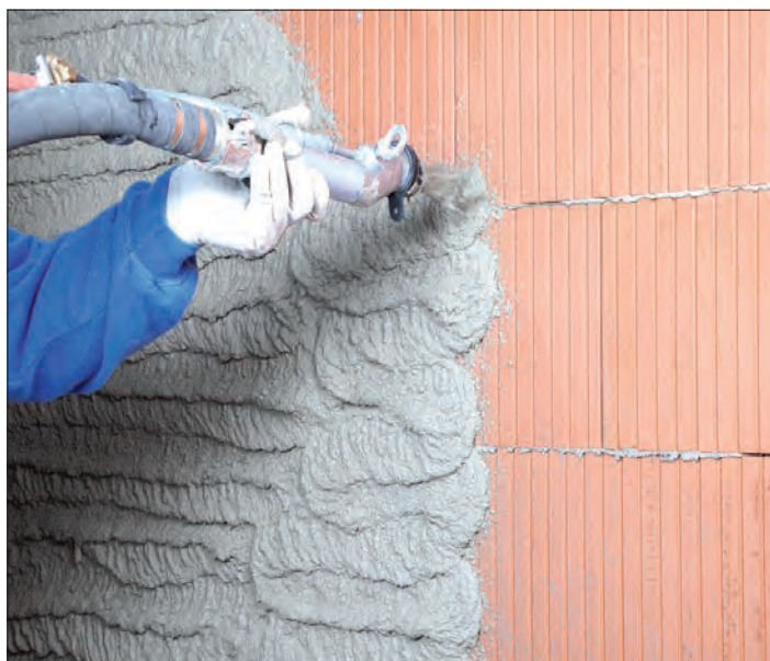
Erster Verarbeitungsschritt: Auftrag per Hand oder Maschine.

sile Rohstoffe benötigt werden. Ein Hersteller setzt bei der neuen Leichtputz-Generation auf rein mineralische Zuschläge wie Blähglasgranulat und verzichtet komplett auf Polystyrol. Das spart Kosten und schont die Umwelt.