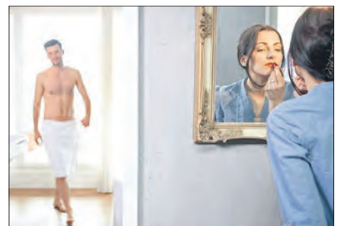
Betondesign hat den Innenraum erobert. In Kombination mit Holz, Naturstein oder Metall unterstreicht der vielseitige Baustoff das stilvolle Badambiente.

räumen. Beispiel Küche: Neben modernen Spülbecken sind bis zu vier Meter lange Arbeitsplatten umsetzbar, die fugenlos in einem Stück gegossen werden. Aussparungen für Einbaugeräte lassen sich gleich mit einplanen. Eine spezielle Imprägnierung schützt die Oberflächen, die durch Schleifen oder Polieren einen interessanten Look erhalten, außerdem vor Feuchtigkeit und Fettflecken - auf diese Weise bewahren sie lange ihre natürliche Schönheit. Das ist auch im Badezimmer von erheblichem Vorteil, schließlich kommen Waschtische aus Beton täglich mit Wasser in Berührung. Küche und Bad sind jedoch längst keine reinen Funktionsräume mehr, deshalb ist es umso erfreulicher, dass zeitgemäße Einrichtungsgegenstände aus Beton auch in puncto Optik überzeugen.